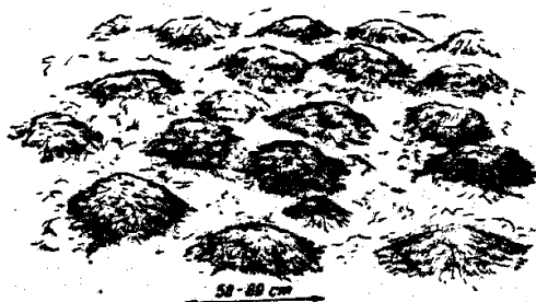
Fig.1. Herniaria glabra L. Plantes à maturité issues par le transplantement des touffes au printemps (octobre, 1982).

On constate que le diamètre de la touffe est 6 fois plus grand, alors que la masse est 41 fois plus grande, durant la période de végétation. De la masse totale de la plante, les tiges représentent environ 20 %, un peu plus grande au début de la végétation (22 %) et de la floraison (21 %) et plus petite en pleine végétation (19 %) lorsque les feuilles et les rameaux florifères atteignent 81 %.